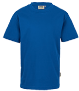
010 bleu roi