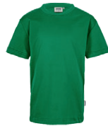
029 vert kelly