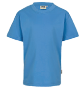
041 bleu malibu