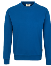
010 bleu roi