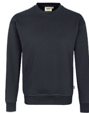
064 gris carbone