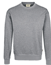
015 gris chiné