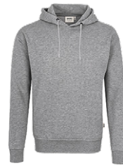
015 grau meliert