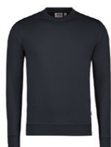
064 gris carbone