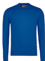
010 bleu roi