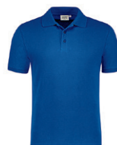
010 bleu roi