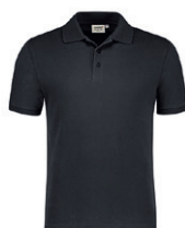
064 gris carbone