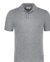
015 gris chiné