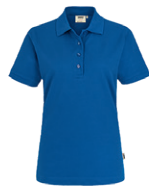
010 bleu roi