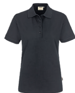
064 gris carbone