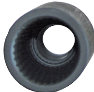
Ø 22 800FSL22