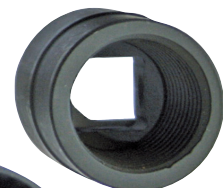
Ø 23 800FSL23