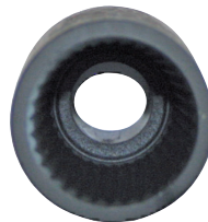
Ø 24 800FSL24