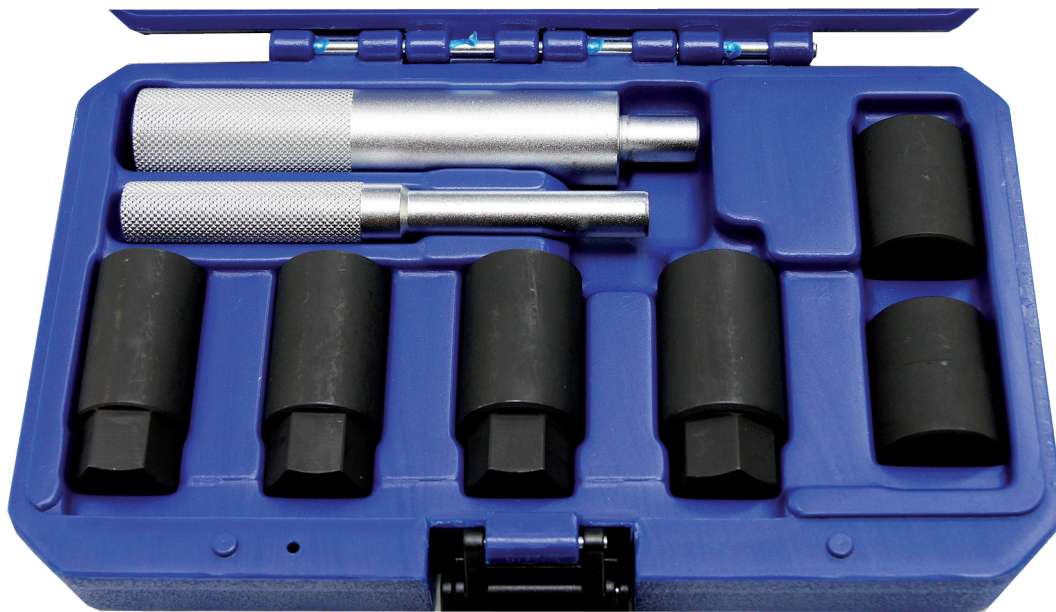
800FSL150DORN / Länge: 1,50

Geeignet für praktisch alle handelsüblichen Felgenschlösser.