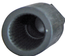
Ø 20 800FSL20