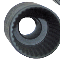
Ø 27 800FSL27